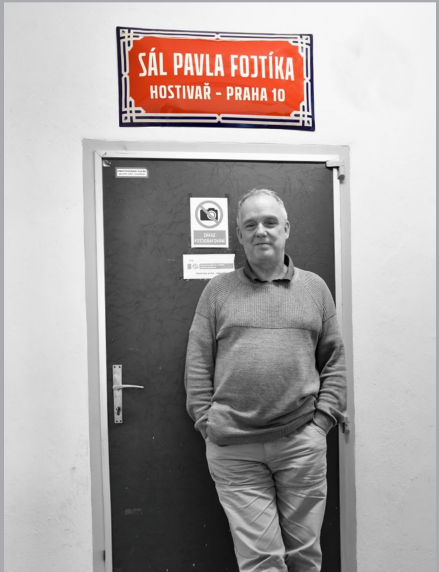
ODCHOD DO DŮCHODU - PŘI TÉTO PŘÍLEŽITOSTI ODHALENO POJMENOVÁNÍ HLAVNÍHO DEPOZITARNÍHO SÁLU ARCHIVU DPP, 29. 5. 2019.