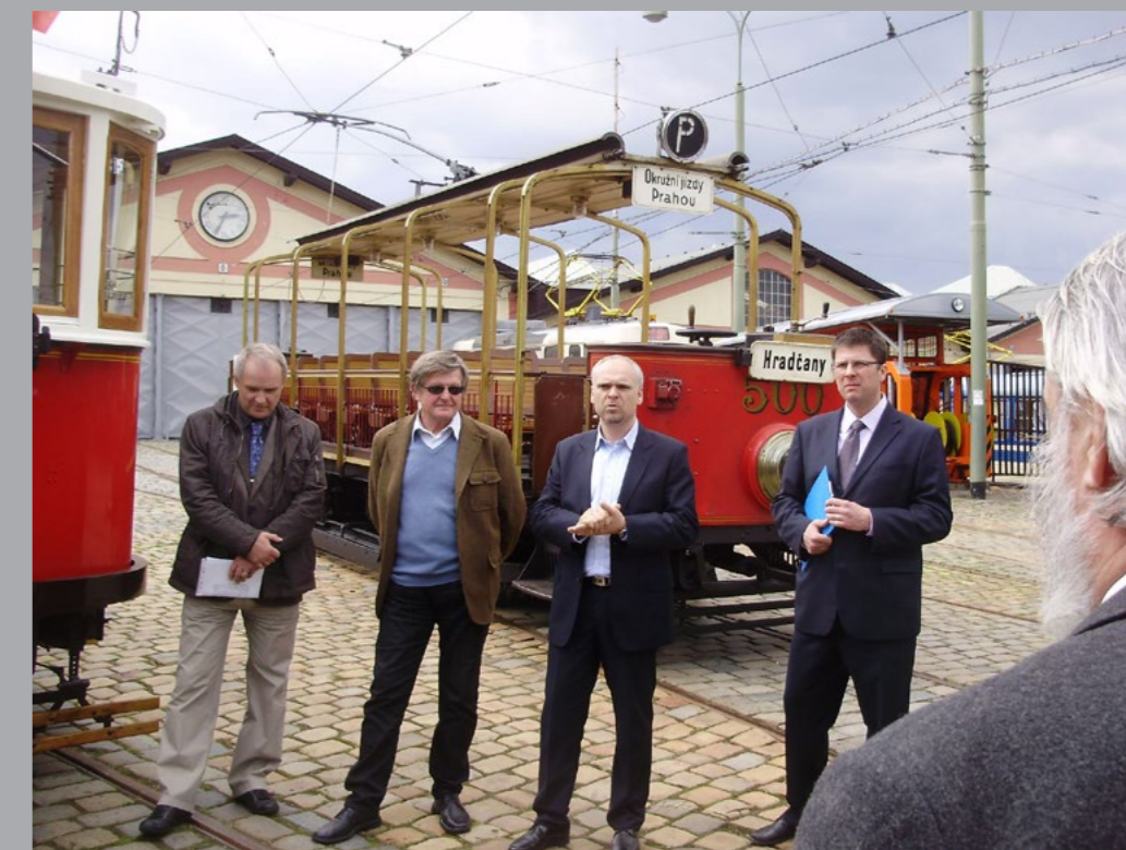
OKRUŽNÍ JÍZDY S VYHLÍDKOVÝM VOZEM 500, 28. 5. 2013.