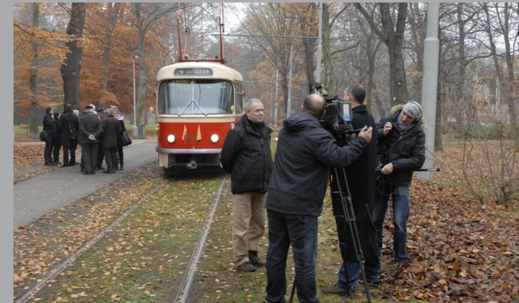
VÝROČÍ 50 LET TRAMVAJÍ T3, LISTOPAD 2012.