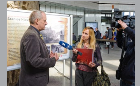
TISKOVÁ KONFERENCE A REPORTÁŽ ZE STANICE KAČEROV PŘI OSLAVÁCH 40. VÝROČÍ ZAHÁJENÍ PROVOZU PRAŽSKÉHO METRA, KVĚTEN 2014.