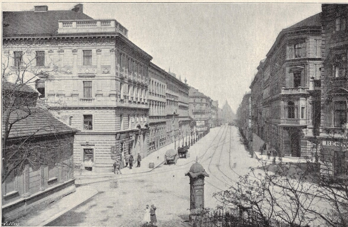
Král. Vinohrady: Havlíčkova třída. (J. Mulač.)

Autobusové linky příměstské a dálkové projížděly přes Vinohrady po různých trasách od roku 1924, pro toto území však měly vždy význam pouze ve vztazích vnějších. Výchozí zastávky autobusových linek vznikly u Wilsonova nádraží, na náměstí Jiřího z Poděbrad a na Floře. Státní linky vedené zejména východním směrem se po II. světové válce soustředily u Hlavního nádraží a ve Strašnicích. Od Hlavního nádraží byly vymístěny až v souvislosti se stavbou severojižní magistrály od 19. března 1973 a přemístěny na dočasné stanoviště do strašnické Počernické ulice, čímž zanikl i jejich průjezdný úsek na Vinohradech. Na vinohradský katastr se některé vrátily o deset let později do terminálu Želivského.