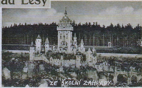
ZE ŠKOLNÍ ZAHRADY