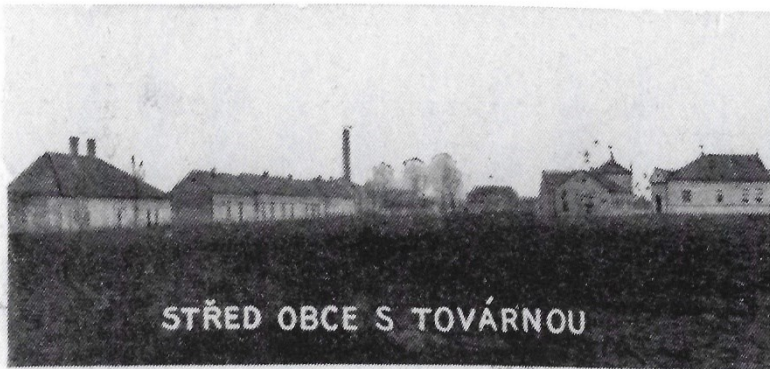
STŘED OBCE S TOVÁRNOU