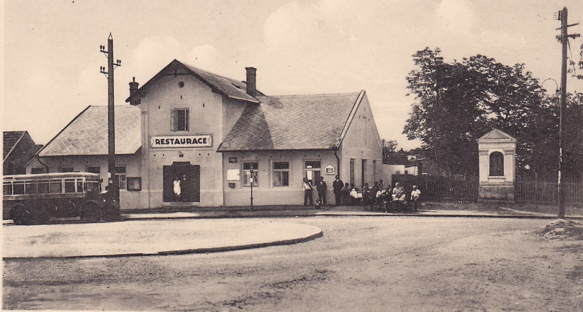
PAŠKOVA ZAHRADNÍ RESTAURACE, PRAHA XV.-LHOTKA. Koneč. stanice autobusu L.