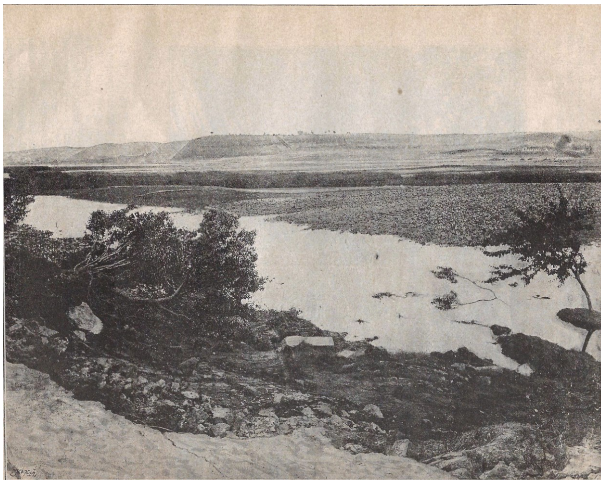
Prvá silnice u Lahoviček.

Připomeňme ještě, že Lahovicemi mohla jezdit tramvaj i trolejbus. Jde však o neuskutečněné projekty, o kterých jsme se zmínili již v kapitole věnované Zbraslavi.